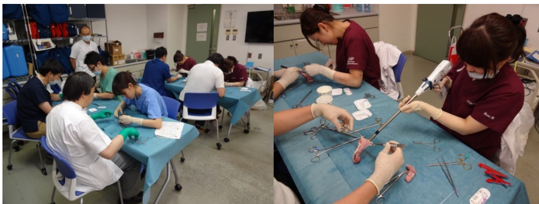
消化管手縫い・器械吻合トレーニング(東京医療センター シミュレーションルーム)

大動物を用いたトレーニング設備や教育DVDなどを用いて積極的に手術手技を学びます。日本外科学会の学術集会(特に教育プログラム)、e-learning、その他各種研修セミナーや各病院内で実施されるこれらの講習会などで、標準的医療および今後期待される先進的医療、医療倫理、医療安全、院内感染対策などについて学びます。