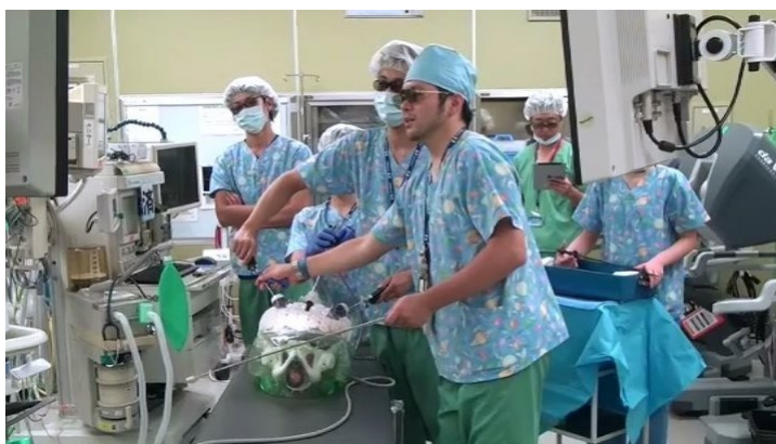
腹腔鏡下鼠径ヘルニア修復術のシミュレーショントレーニング(東京医療センター 手術室)