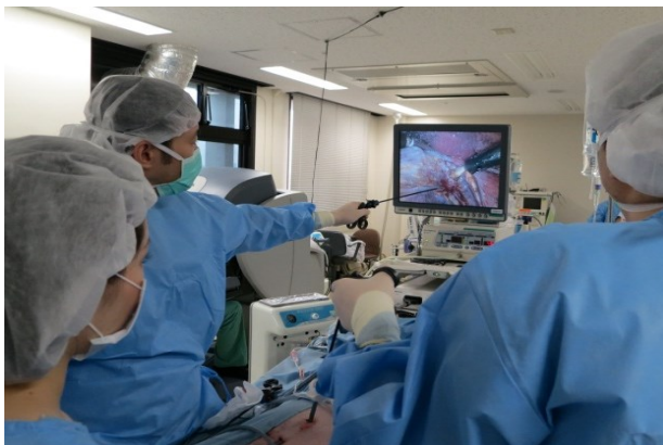
国立病院機構内視鏡手術セミナー(東京医療センタートレーニングセンター)